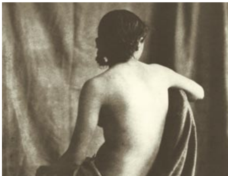
Eugène Durieu (1800–1874): Akt (Ausschnitt), um 1853, Salzpapierkopie

www.stopp-kinderpornografie.ch (webcode 2204d)