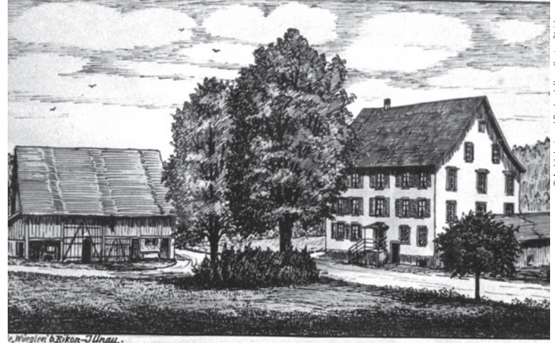
«Würglen b. Rikon - Illnau»

www.ilef.ch www.denkmalaktiv.ch www.traubeottikon.ch