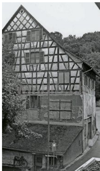
Die Hofstadlerscheune vor dem Umbau 1979.