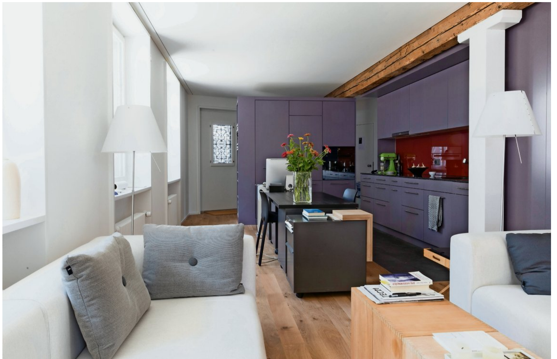
Die nach Süden orientierten Fenster lassen Wohn- und Küchenbereich grosszügig wirken. Die alten Trägerbalken harmonieren gut mit den neuen Einbauten aus grauem MDF.

Die Vorgabe lautete, zwei 2½-Zimmer-Wohnungen darin unterzubringen. Dabei galt es, zugleich denkmalpflegerische Anliegen und aktuelle Bauvorschriften einzuhalten. Was bei einer Treppe, die zuvor beide Geschosse vom Eingang auf der Südseite her erschloss, zu einem Dilemma führte: «Gemäss Denkmalpflege musste sie erhalten werden, gemäss Bauvorschriften war sie zu schmal», erzählt Joa-