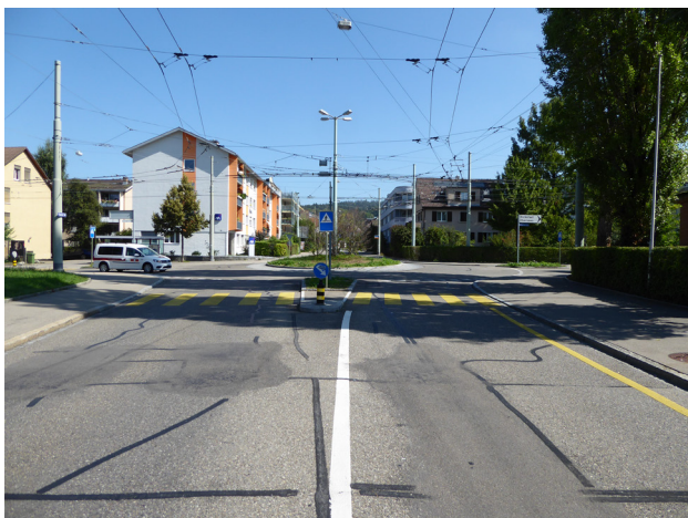
Abbildung 3: Kanzleistrasse / Kreisel Landvogt-Waser-Strasse Schlechter Fahrbahnzustand Kanzleistrasse. Am Kreisel Kreuzen die Stadtbuslinien 2 / 9 (Kanzleistrasse, Richtung Bahnhof Seen) mit der 3 (Landvogt-Waser-Strasse, Richtung Oberseen).