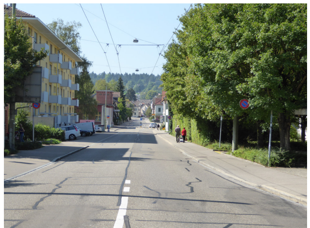
Abbildung 4: Kanzleistrasse vom Landvogt-Waser-Strasse aus Gestreckte Linienführung mit grosser optischer Breite des Strassenraums. Eine Veloinfrastruktur ist nicht vorhanden. Vor dem linken Wohngebäude befinden sich private Parkplätze; Rückwärtsfahrmanöver auf die Kanzleistrasse sind notwendig.