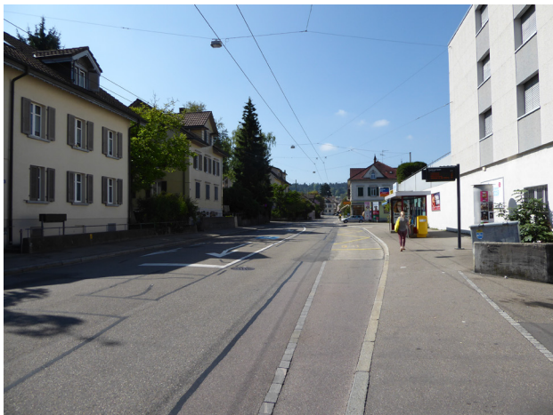
Abbildung 7: Kanzleistrasse, Bushaltestelle Zentrum Seen Fahrtrichtung Tösstalstrasse Trotz tiefer Verkehrsbelastung ist eine Busbucht vorhanden und Linksabbiegestreifen für die Einfahrt Tiefgarage Shopping markiert.