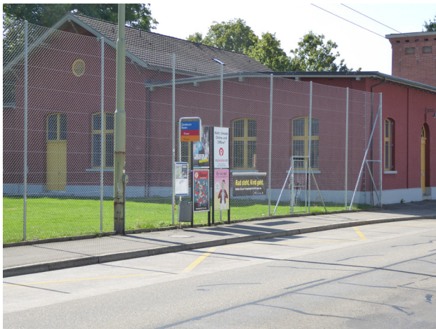
Abbildung 5: Freizeitanlage Kanzleistrasse Gegenüber dem Shopping Seen befindet sich die Freizeitanlage Kanzleistrasse des Ortsvereins Seen mit Veranstaltungsgebäude und grosser Wiese für Aufenthalt und Spiel.