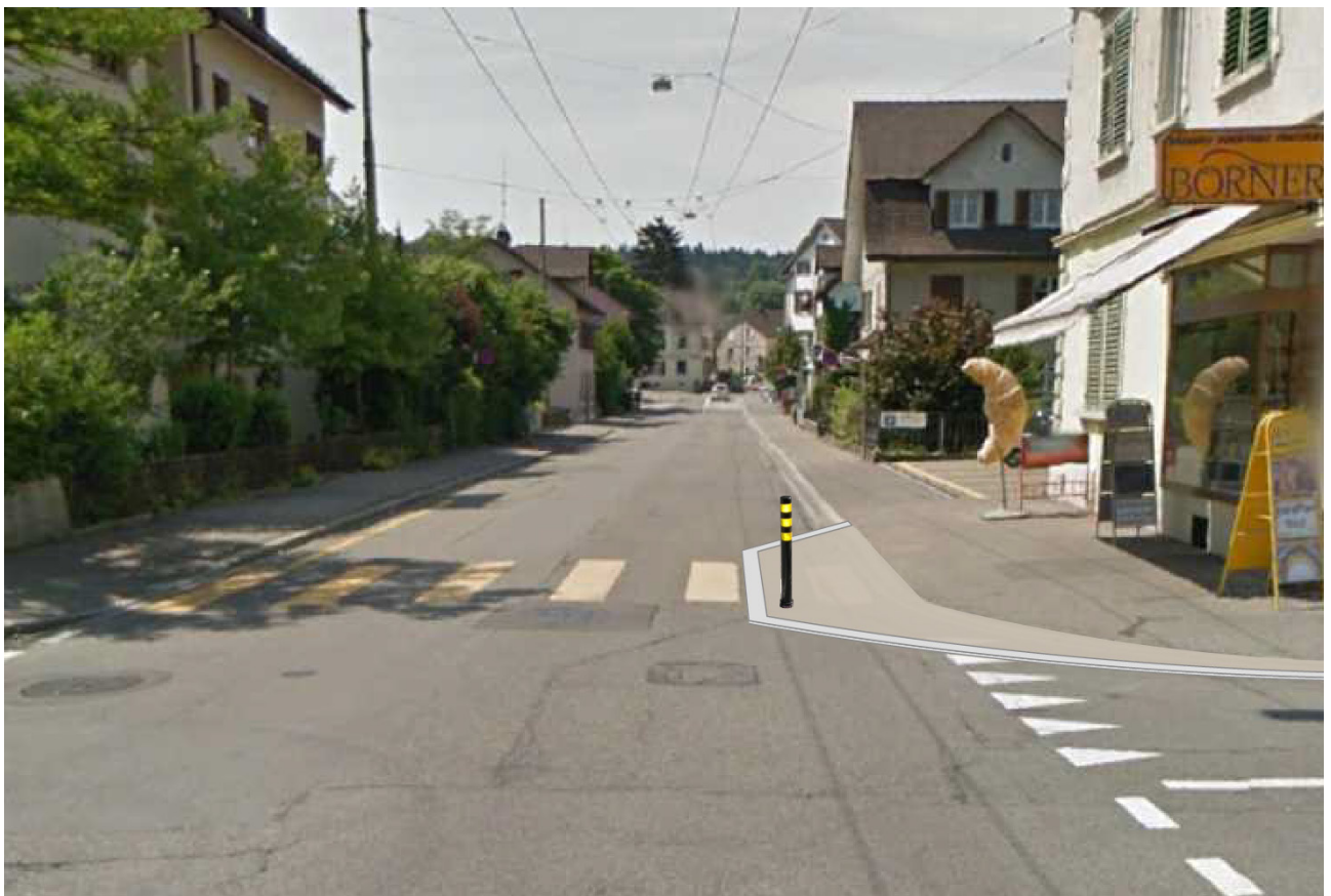
Abbildung 9: Visualisierung – Trottoirnase beim Schulwegübergang

Zum Schutz für wartende Fussgänger und zur besseren Erkennbarkeit für Fahrzeuglenker dient ein Poller.