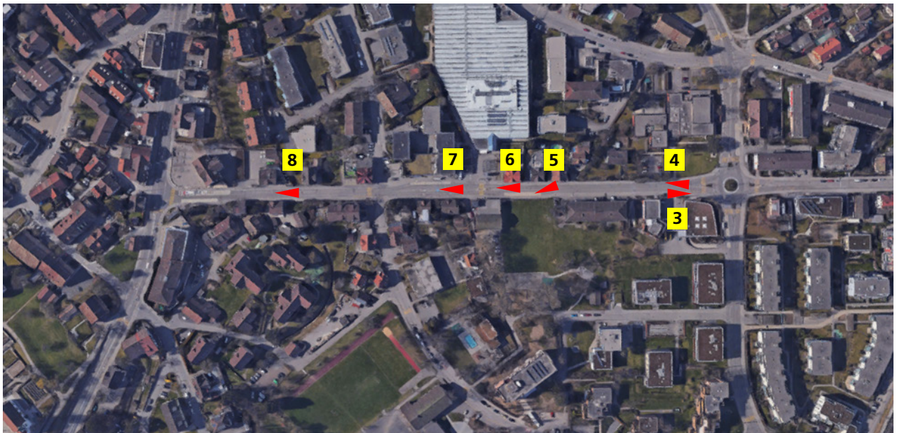
Abbildung 2: Übersichtsplan mit den Standorten der Fotos