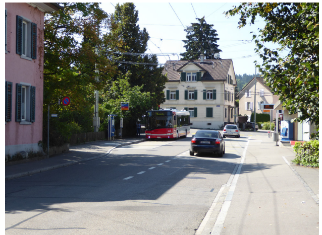
Abbildung 8: Knoten Kanzleistrasse / Tösstalstrasse mit Haltestelle Schulhaus Seen Die Haltestelle Schulhaus Seen ist nur etwa 150 m von der Haltestelle Zentrum Seen entfernt. In Richtung Knoten ist diese als Fahrbahnhaltestelle, in Richtung Zentrum Seen als halbe Busbucht ausgestaltet.