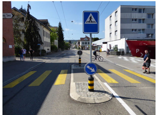
Abbildung 6: Kanzleistrasse am Shopping Seen Zentraler Fussgängerstreifen zwischen den Bushaltestellen Zentrum Seen. Dazwischen befindet sich die Tiefgaragenzufahrt zum Shopping.