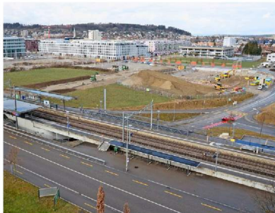
Der Blick auf das Bau- und anfangen zu bauen. So haben es Stadt und Eigentümer vertraglich vereinbart.

Die Solarstrasse wird erst im Frühling 2021 verlängert, doch gebaut wird beim Bahnhof Hegi bereits in diesem Jahr, und zwar im grossen Stil. Beim Projekt «Kim» entsteht etappenweise eine Überbauung mit über 430 Wohnungen und einem Gewerbeanteil von 50 Prozent, verteilt auf fünf u-förmige Gebäude. Den Anfang macht die Implenia. Sie plant entlang der Sulzerallee 200 günstige 2½- bis 5½-Zimmer-Wohnungen. Der Immobilienfonds der Mobilbar baut 130 Wohnungen, davon 40 Alterswohnungen und auf der angren-