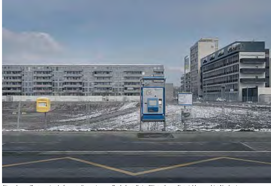
Ein urbanes Zentrum im Anfangsstadium: einsame Bushaltestelle im Winterthurer Entwicklungsgebiet Neuhegi.

Industrielle und gewerbliche Nutzungen sollen auch künftig den Schwerpunkt bilden. Die Stadt rechnet gemäss ihren Planungen bei einem Vollausbau Neuhegis mit einem Szenario von