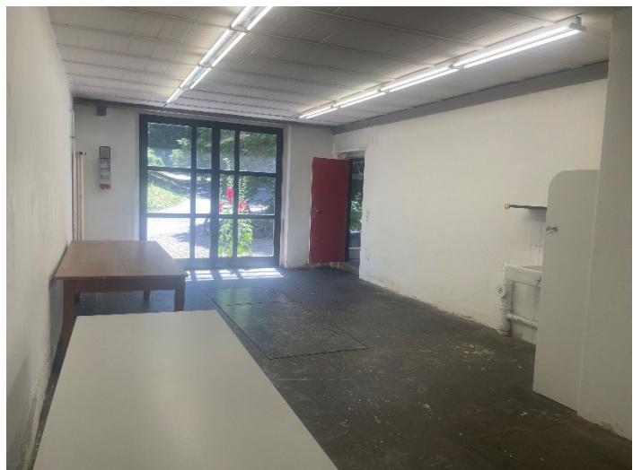
Raum EG rechts, in der «Remise Büelrain» des Amts für Kultur der Stadt Winterthur.