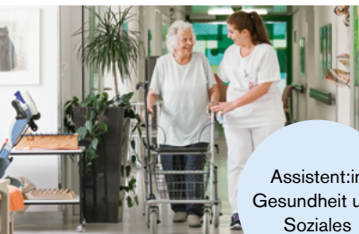
Assistent:in Gesundheit und Soziales