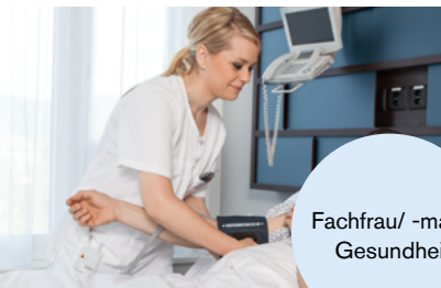
Fachfrau/ -mann Gesundheit