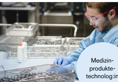
Medizin- produkte- technolog:in