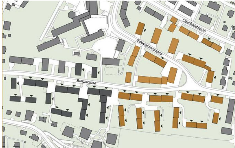
Abb. 3: Gebiet (beige Gebäude), für welches das Servitut SP 827 gilt.