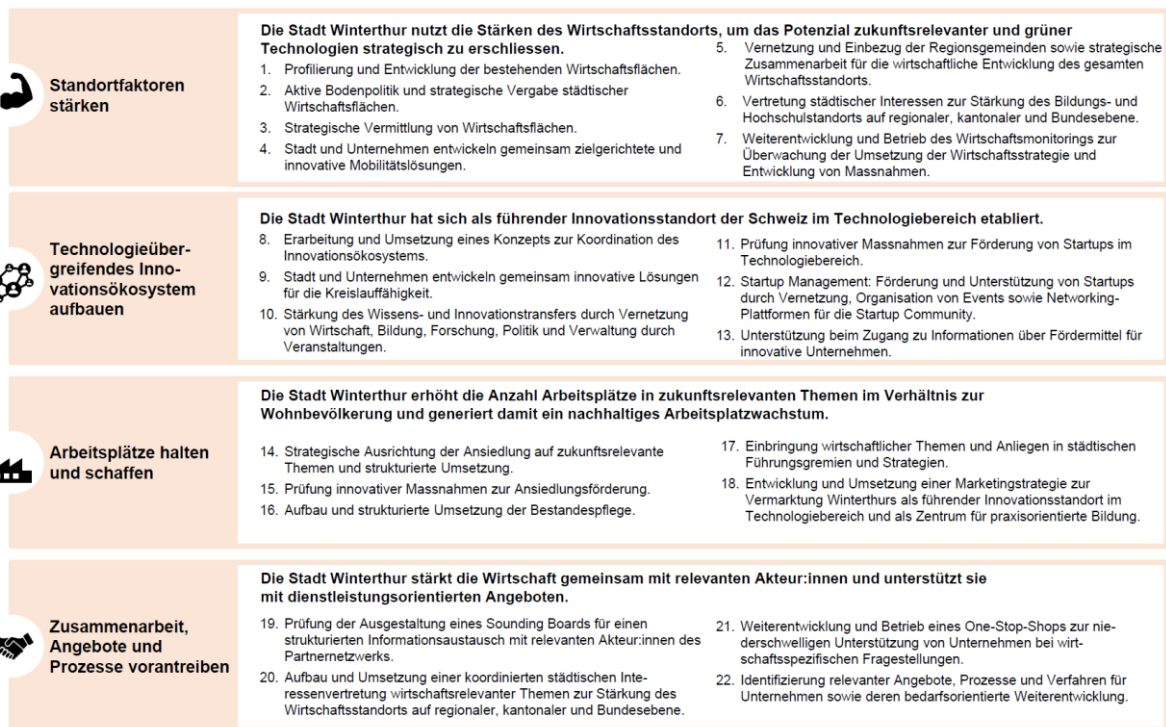
Abbildung 2: Strategische Zielsetzungen und Massnahmen Wirtschaftsstrategie 2026 entlang der vier Handlungsfelder

Zur Erreichung der gesetzten Ziele sind jedem der vier Handlungsfelder mehrere Massnahmen zugeordnet. Insgesamt umfasst die vorliegende Wirtschaftsstrategie 22 Massnahmen (vgl. Abbildung 2).