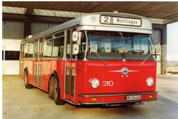
Abb. 26: Autobus Saurer, 1965.