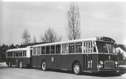
Abb. 24: Autobus Mowag, 1955, mit Anhänger, 1953.