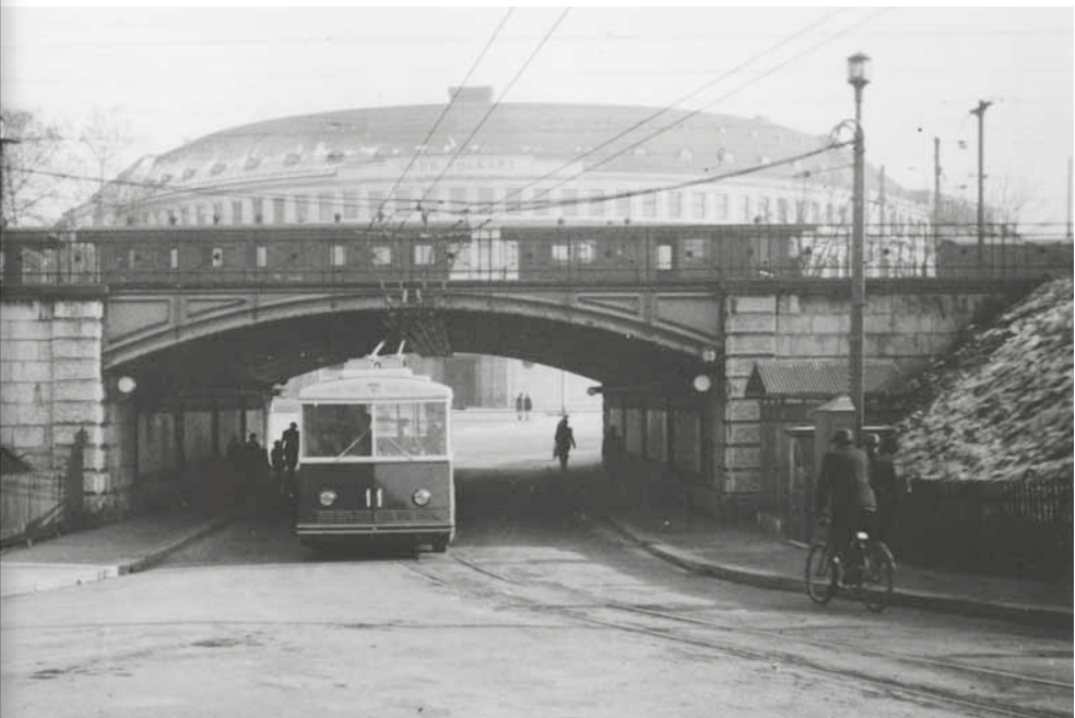
Abb. 4: Trolleybus der ersten Serie in der Wülflinger Unterführung.

1948 Umstellung der Autobuslinie nach Rosenberg auf Trolleybusbetrieb (Rückfahrt via Graben – Technikumstrasse).