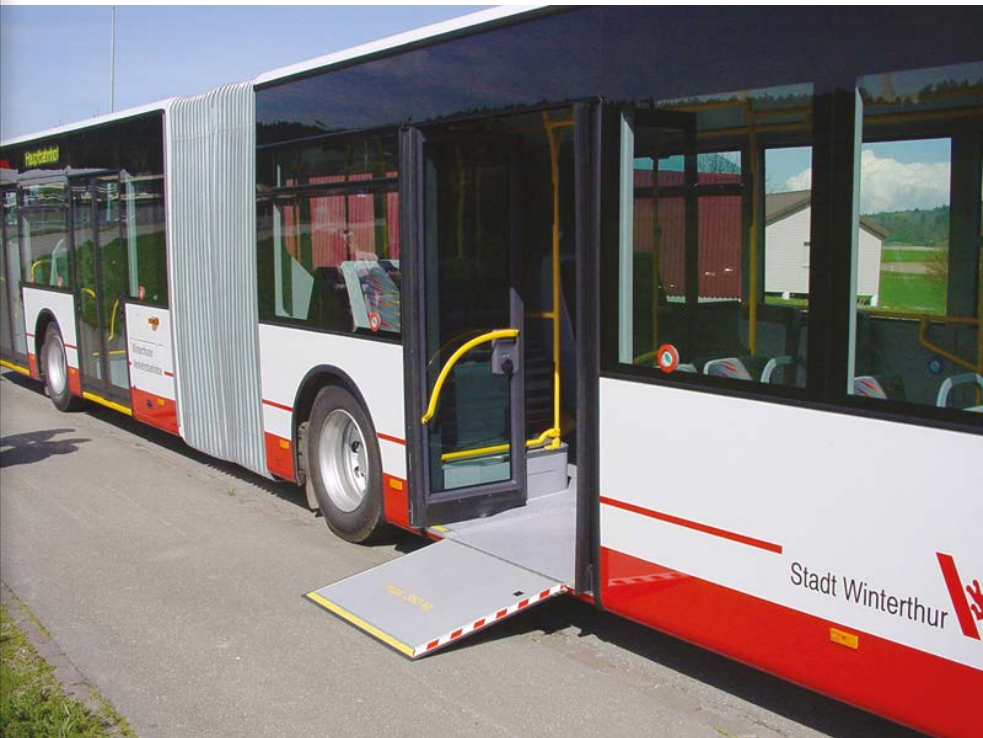
Abb. 17: Ausfahrbare Rollstuhlrampe für barrierefreien Zugang.

1998 «Depothalt». Die WV werden 100-jährig, und ein Medienanlass gibt den Startschuss zu diversen Jubiläumsaktionen für Kundinnen und Kunden sowie Mitarbeiterinnen und Mitarbeiter. Die Anlässe sind über das ganze Jahr verteilt.