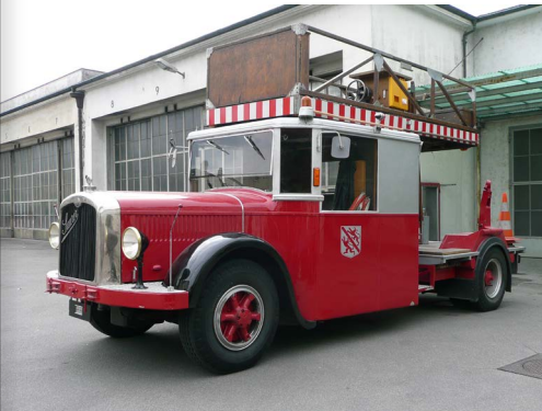
Abb. 23: Von Stadtbus zum Turmwagen umgebauter Saurer, 1931.