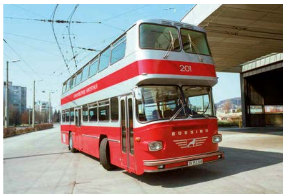
Abb. 27: Doppeldecker Büssing, 1971.