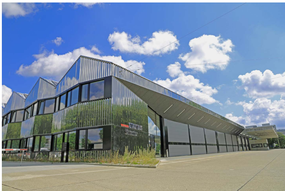
Abb. 32: Neuer Verwaltungstrakt und erweiterte Einstellhalle.

Im August fahren erstmals alle Busse ausschliesslich ab Depot Grüzefeld. Bis auf das Kundenzentrum ZVV-Contact sind nun alle Bereiche an einem einzigen Ort konzentriert. Mit einem Tag der offenen Tore feiert Stadtbus im September den Abschluss der Bau- und Sanierungsarbeiten des Depots Grüzefeld. Rund 7000 Besucherinnen und Besucher folgen der Einladung, einen Blick hinter die Kulissen zu werfen (Abb. 33–36).