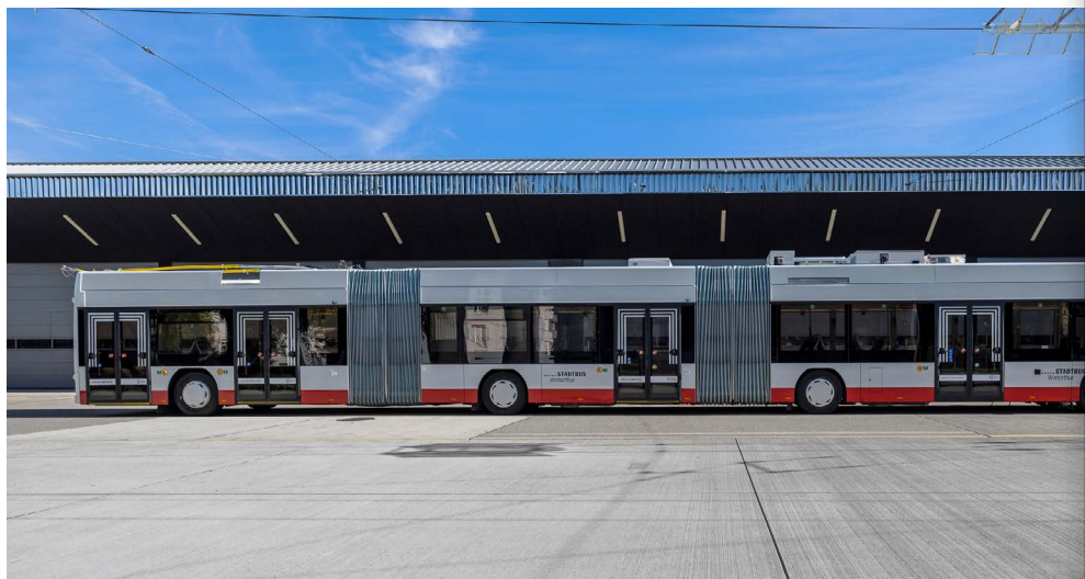
Abb. 44: HESS lighTram, 25 DC (Typ BGGT-N2D) der Carrosserie HESS AG 24.7 Meter lange, Platz für 220 Personen, digitaler Rückspiegel, Tempomat (einstellbar auf 30 und 50 km/h), ökologisch optimierte Heizung

Bei der Elektrifizierung der Linien 5 und 7 genehmigt der Kantonsrat den Kredit einstimmig.