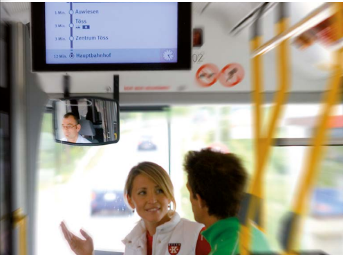
Abb. 21: Informationssystem in allen Bussen.

2007 Nach einem mehrmonatigen Versuchsbetrieb werden sämtliche Busse mit Bildschirmen ausgerüstet, welche die nächsten Haltestellen, die voraussichtliche Fahrzeit und die vorhandenen Umsteigemöglichkeiten anzeigen. Ebenso werden wichtige Halteketten mit dynamischen Abfahrtsanzeigen ausgerüstet. Damit erhalten die Fahrgäste aktuelle Abfahrtszeiten und Hinweise auf allfällige ausserordentliche Situationen (Abb. 21).