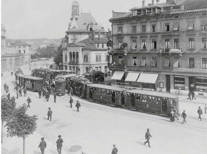
Abb. 2: Ab 1915 gehört die Strassenbahn fest zum Winterthurer Stadtbild.