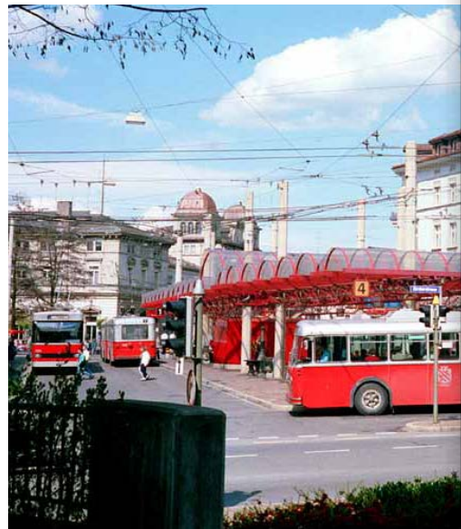
Abb. 14: Neugestalteter und überdachter Busbahnhof.

1982 Eröffnung einer Eilkursverbindung mit Doppeldecker-Autobussen (ehemalige Swissairbusse) HB–Technorama–HB (Abb. 13). Neukonzeption des Liniennetzes: Separierung der Linien Rosenberg und Breite. Die Steig wird werktags während der Hauptverkehrszeiten mit einer direkten Linie zum HB bedient. Die Linien Lindenplatz–Eichliacker und HB–Oberseen werden eröffnet. Verlängerung der Trolleybuslinie nach Oberwinterthur bis Wallrüti.