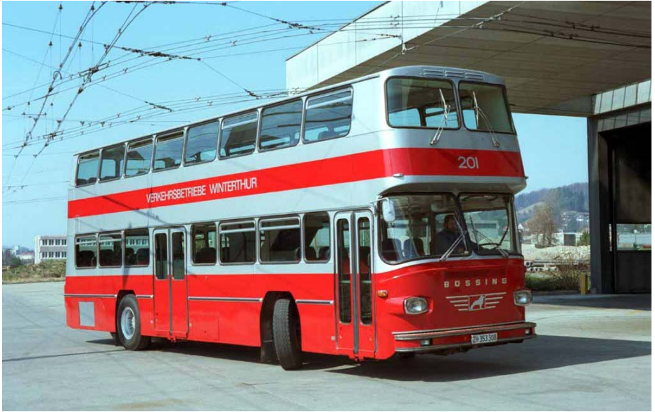
Abb. 13: Einer von zwei Doppeldecker-Autobussen für den Eilkurs HB–Technorama–HB.

1982 Eröffnung einer Eilkursverbindung mit Doppeldecker-Autobussen (ehemalige Swissairbusse) HB–Technorama–HB (Abb. 13). Neukonzeption des Liniennetzes: Separierung der Linien Rosenberg und Breite. Die Steig wird werktags während der Hauptverkehrszeiten mit einer direkten Linie zum HB bedient. Die Linien Lindenplatz–Eichliacker und HB–Oberseen werden eröffnet. Verlängerung der Trolleybuslinie nach Oberwinterthur bis Wallrüti.