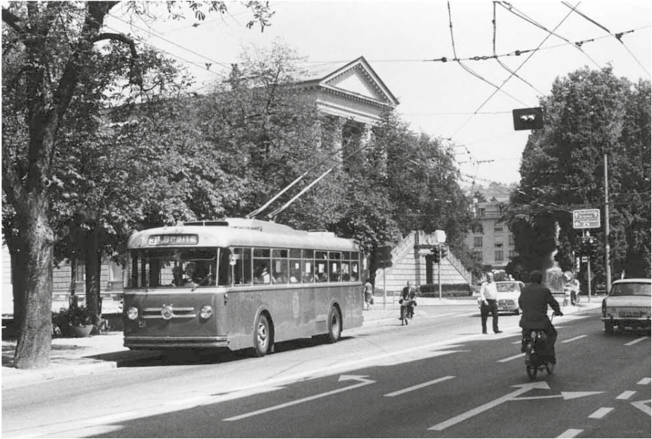
Abb. 7: Neue Durchmesserlinie Rosenberg–Breite mit neuen Trolleybussen.