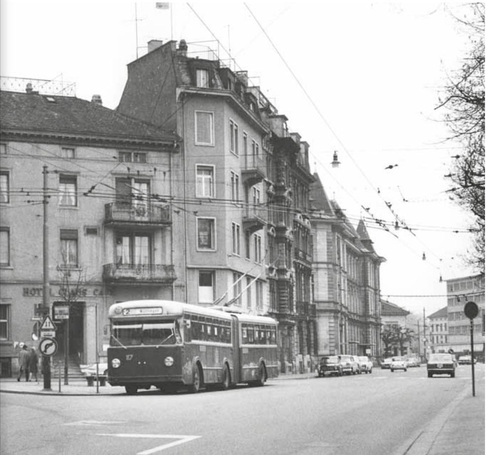
Abb. 11: Einer von 14 Gelenktrolleybussen der Schweizer Marke Berna.

1974 Eröffnung einer Autobuslinie Steig – Zürcherstrasse – HB – Technikumstrasse – Deutweg – Grüzefeld – Seenerstrasse – Pfaffenwiesen unter gleichzeitiger Aufhebung der Linie Waldheim – Rychenberg.