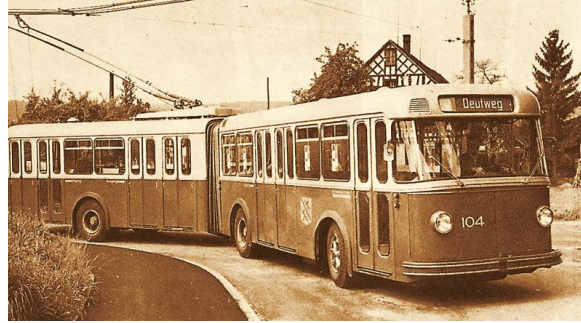
Abb. 25: Gelenktrolleybus FBW, 1958.

2010 Von der beachtlichen Sammlung gesamtschweizerischer Oldtimer werden aus Stadtbus-Bestand fünf herausragende Exponate mit besonderer kultureller Bedeutung für die schweizerische Mobilitätsgeschichte nominiert. Sie bleiben im Besitz von Stadtbus. (Abb. 23–27).