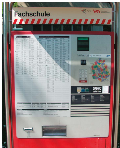
Abb. 15: ZVV-Billettautomat der ersten Generation.