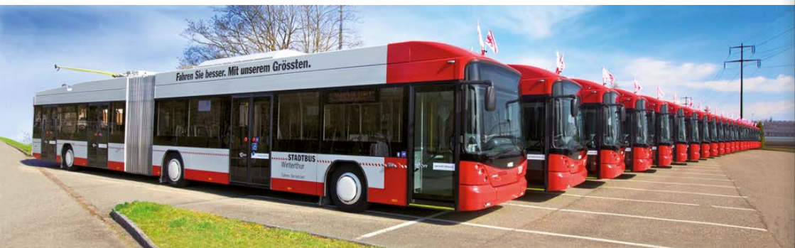
Abb. 28: Die 21 Hess-Niederflur-Gelenktrolleybusse.

2013 Nach einjähriger Bauzeit rollen die Busse wieder über den neugestalteten Bahnhofplatz Süd. Gleichzeitig wird das neue Beratungszentrum ZVV-Contact eröffnet (Abb. 31).