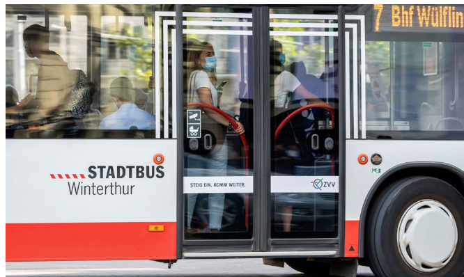
Abb. 41–43: Zwischen Oktober 2020 und 2021 gilt im öffentlichen Verkehr Maskenpflicht.