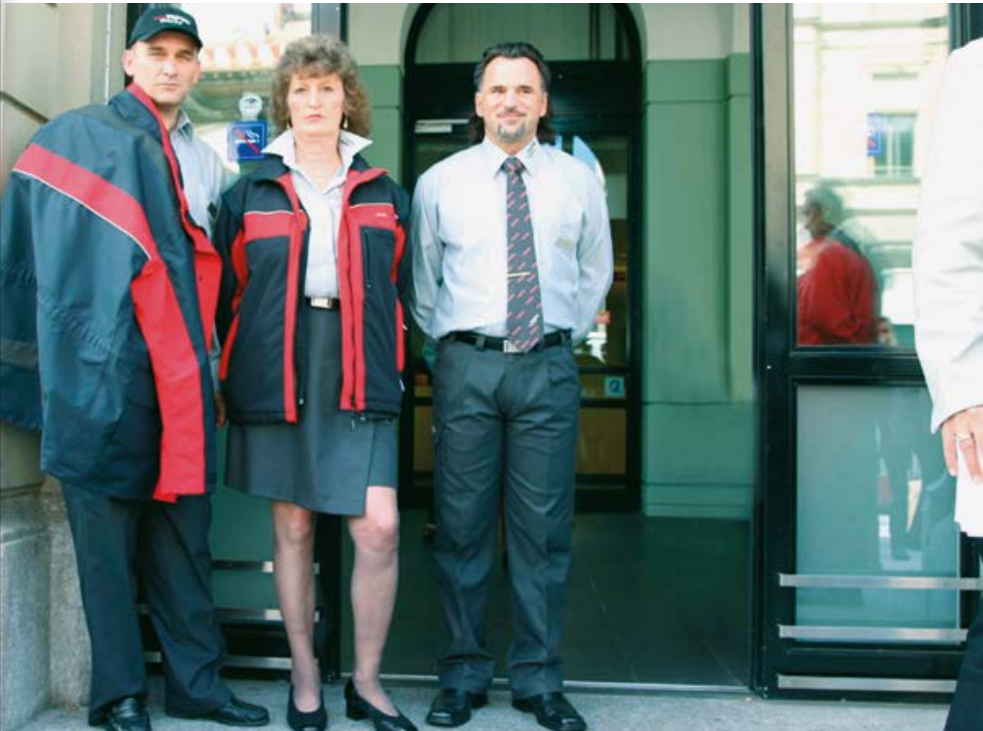
Abb. 19: Neue Bekleidung für Fahrpersonal.

Alle Dieselbusse werden mit CRT-Partikelfiltern ausgerüstet, die den Ausstoss von Krebs erregenden Russpartikeln verhindern.