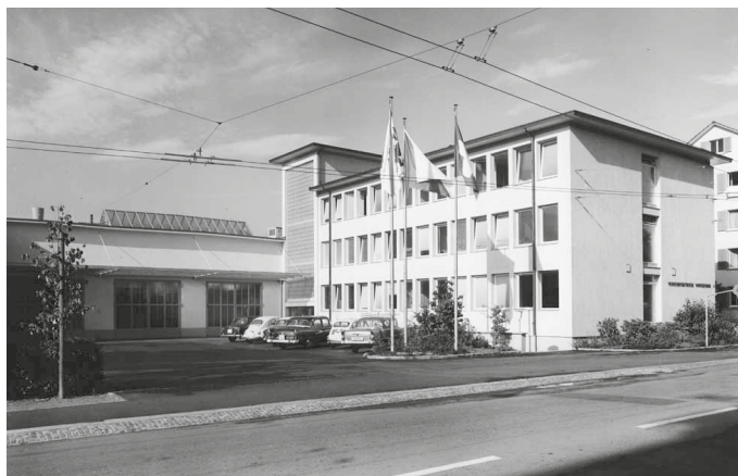
Abb. 5: Erweitertes Depot und neues Verwaltungsgebäude im Deutweg.

1960 Umbau des Bahnhofplatzes. Sperrung des Busbahnhofs für den privaten Verkehr. Die seit 1933 von einer privaten Autobus-Gesellschaft betriebene Breite-Linie wird von den Verkehrsbetrieben übernommen, auf Trolleybusbetrieb umgestellt und mit der Rosenberglinie zusammengelegt (Abb. 7). Verlängerung der Trolleybuslinie nach Wülflingen bis Härti.