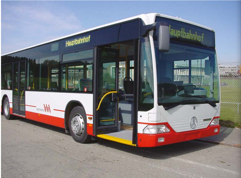
Abb. 16: Mercedes-Citaro-Gelenkautobus, durchgehend niederflurig.

1996 Der Nachtbus Zürich – Winterthur verkehrt auch in der Nacht von Freitag auf Samstag.