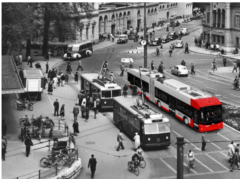
Abb. 40: Collage zum Jubiläumsjahr.

Grosse Freude bereitet den Nachtschwärmer das neue Nachtangebot. Per Fahrplanwechsel im Dezember ist das Nachtnetz komplett erneuert, verdichtet und dem Tagnetz angeglichen worden.