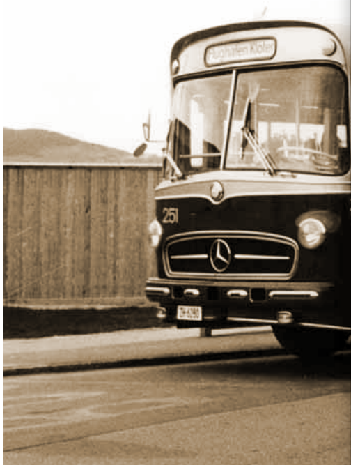
Abb. 8: Überlandbus Winterthur – Flughafen in Zürich-Kloten.

1965 Verlängerung der Trolleybuslinie nach Töss von der Bahnlinie bis Rieter.