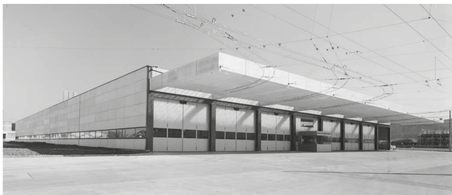
Abb. 9: Neues Busdepot Grüzefeld, in Ergänzung zum Depot Deutweg.