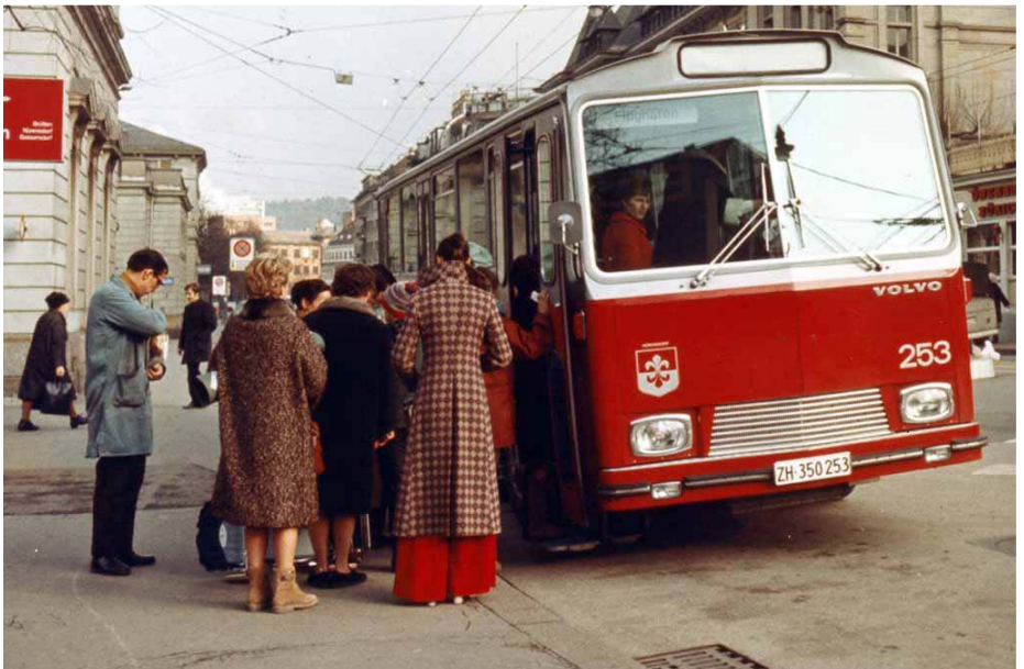
Abb. 12: Ein Überlandbus der Strecke Winterthur–Brütten–Bassersdorf–Flughafen, getauft auf den Namen Nürens Dorf.