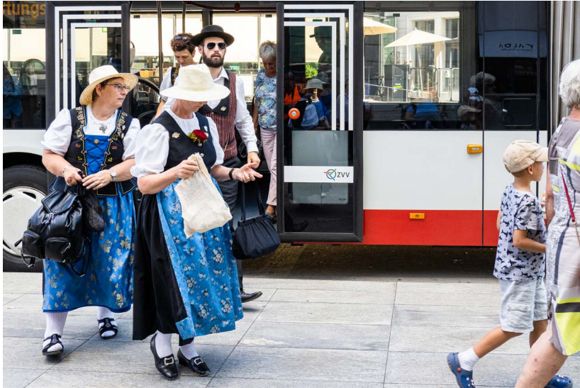
Abb. 38–39: Grosseinsatz für Stadtbus am Nordostschweizer Jodlerfest.

2019 Das Nordostschweizer Jodlerfest findet in Winterthur statt. Stadtbus trägt wesentlich dazu bei, dass die rund 45 000 Besucherinnen und Besucher problemlos zum Festgelände in Wülflingen und zurück fahren können (Abb. 38 und 39).