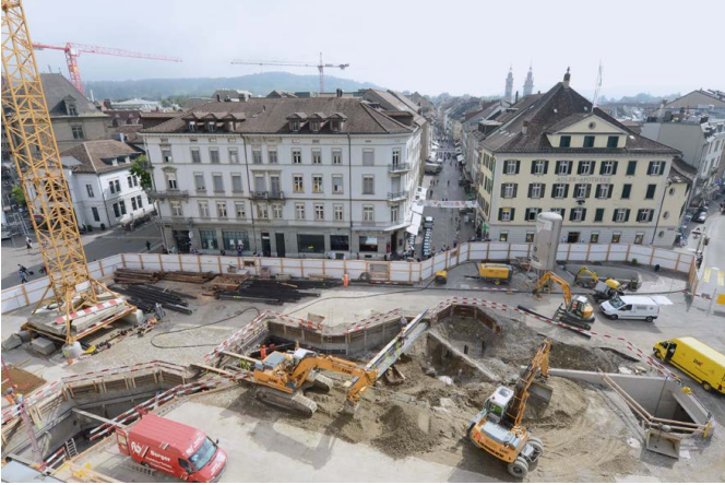
Abb. 29: Grossbaustelle am Hauptbahnhof.