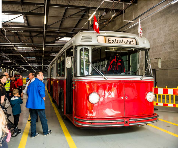
Abb. 33–36: Tag der offenen Tore im Grüzefeld.