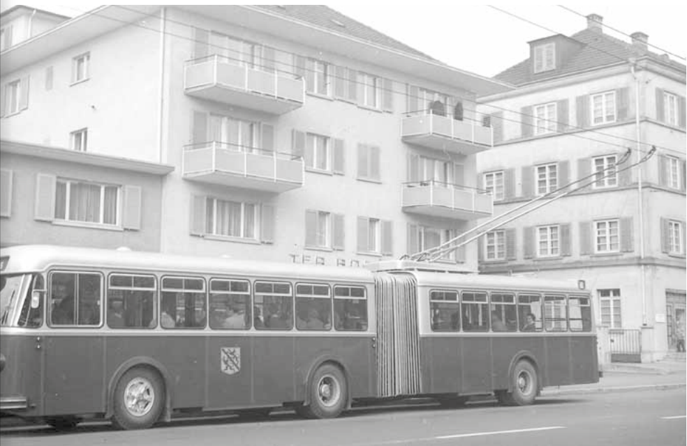
Abb. 6: Gelenktrolleybus auf der Zürcherstrasse in Töss.