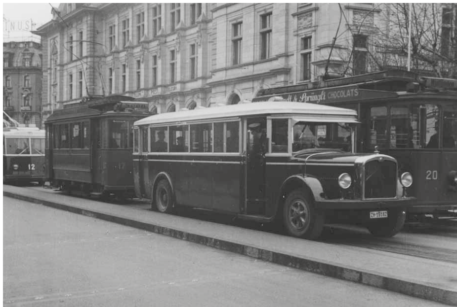
Abb. 3: Rosenberg-Autobus vor der Hauptpost am Bahnhof.

1931 Eröffnung der Autobuslinie nach Rosenberg mit drei Autobussen (Abb. 3). Tramlinienverlängerung vom Stadtrain bis zum Bahnhof Oberwinterthur.