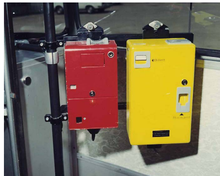
Abb. 10: Mehrfahrtenkartenentwerter (links) und Billettausgabegerät für Einzelfahrten (rechts).

1968 Einführung der Selbstbedienung (Billettausgabegeräte und Felderkartenentwerter im Bus, Einheitstarif, Abb. 10).