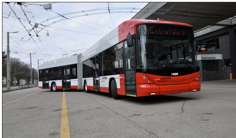
Abb. 22: Der erste von 21 Niederflur-Gelenktrolleybussen.

Der erste Hess-Trolleybus trifft ein (Abb. 22).