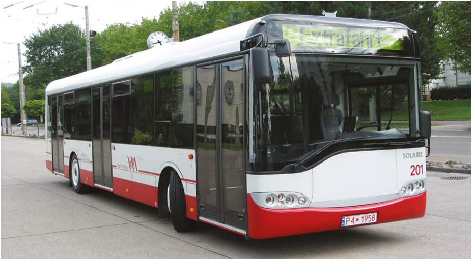
Abb. 18: Der erste Solaris Urbino 12, noch im alten Erscheinungsbild.

2002 Die Bauarbeiten zur Neugestaltung des Bahnhofplatzes zwischen dem Aufnahmegebäude SBB und dem Postgebäude werden aufgenommen. Der Umbau dauert rund ein Jahr.