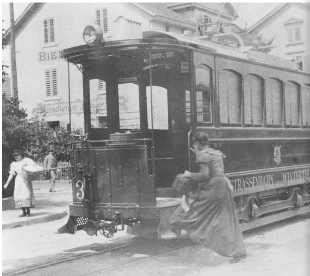
Abb. 1: Motorwagen Nummer 3 auf der Rudolfstrasse hinter dem Bahnhof Winterthur.