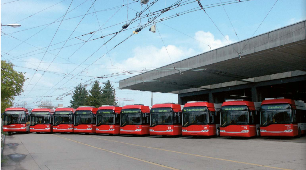
Abb. 20: Die zehn Niederflur-Gelenktrolleybusse Solaris Trollino 18 in Reih und Glied.

2006 Die letzten der im Mai 2005 bestellten zehn Niederflur-Gelenktrolleybusse Solaris Trollino treffen ein (Abb. 20).