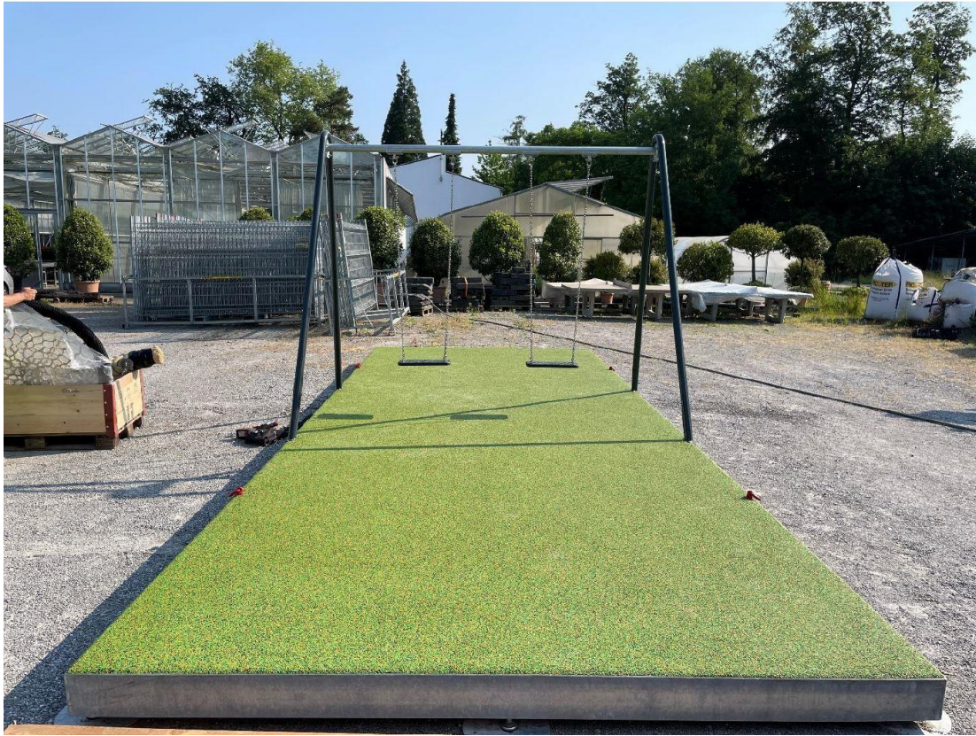
Mobile Schaukel: Doppelschaukel