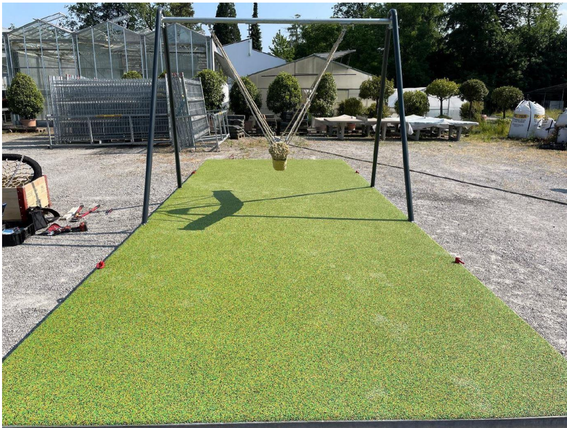
Mobile Schaukel: Dschungelschaukel