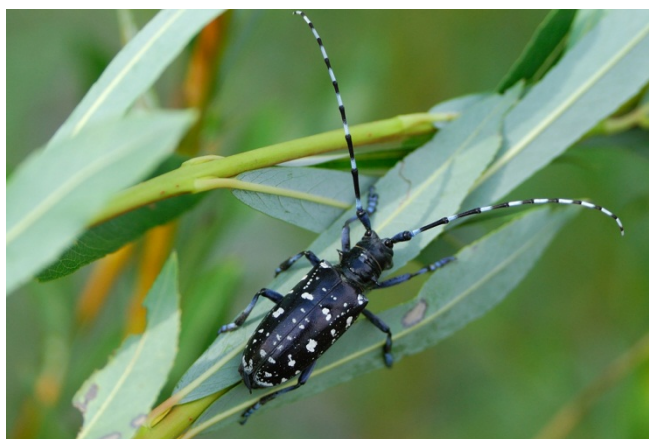
Der ALB ist schwarz mit über den Körper verteilten hellen Flecken. Ohne Fühler ist er 25-35 mm lang. Die Fühler haben eine Länge von 25-80 mm.