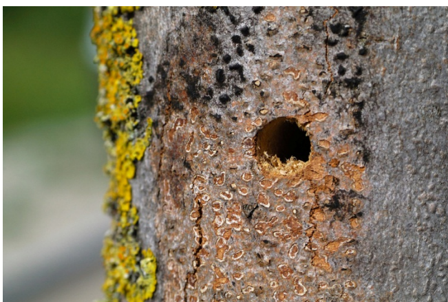
Die kreisrunden Ausfluglöcher der Käfer haben einen Durchmesser von 10 mm.

Verdachtsfälle und Funde sind der Stadtgärtnerei zu melden, Telefonnummer 052 267 30 00 oder per E-Mail an stadtgaertneri@win.ch . Gefundene Käfer sollten in einem Konfitürenglas gefangen und fotografiert werden.