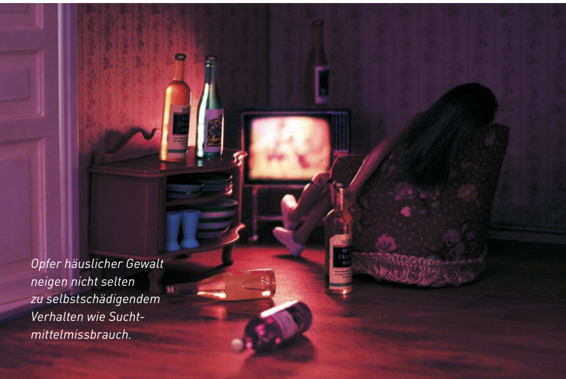
Opfer häuslicher Gewalt neigen nicht selten zu selbstschädigendem Verhalten wie Suchtmittelmissbrauch.

Auch die Gesellschaft trägt die Kosten häuslicher Gewalt mit, die gemäss Untersuchungen jährlich bei einem dreistelligen Millionenbetrag liegen.