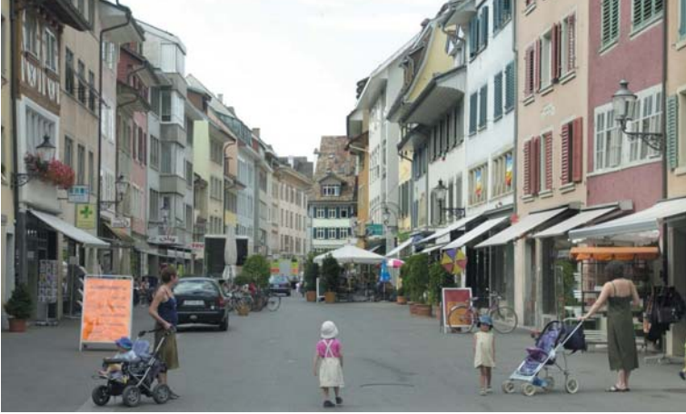
Eingeschränkte Gassenperspektive durch Werbetafeln, Begrünungen und überdimensionierten Sonnenschutz