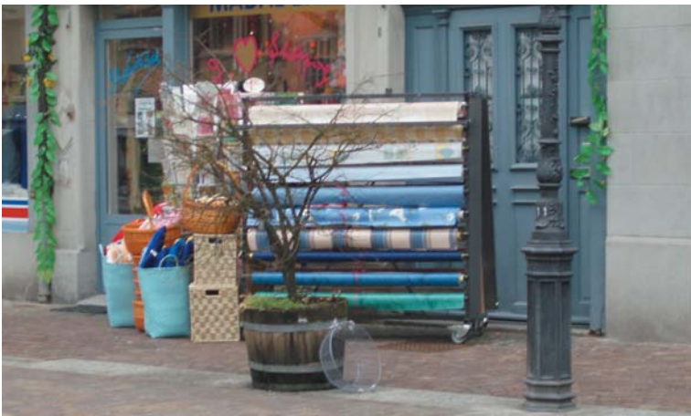
Warenauslage und Begrünung sind wenig ansprechend