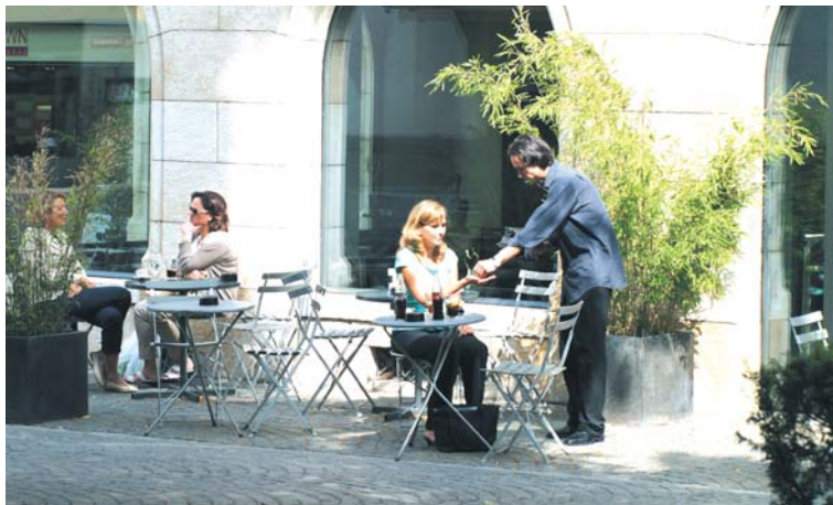
Gut gewähltes Mobiliär und zurückhaltende Begrünung

Bereits bestehende Strassencafés und -restaurants, welche die neu geltenden Vorgaben nicht erfüllen können, sind bis Ende 2008 anzupassen.