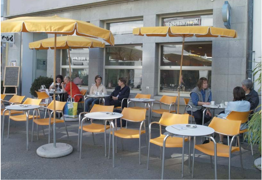
Ansprechendes Erscheinungsbild eines Altstadt-Cafés