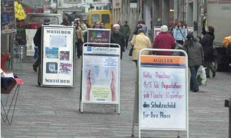
Werbetafeln verdrängen die Passanten