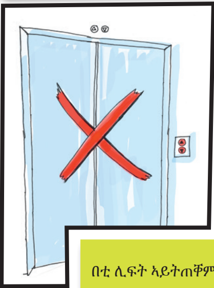
ቦቲ ሊፍት አይትጠቐም