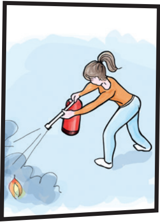
ነቲ ሐዋ ንምጥፋእ ምቅላስ