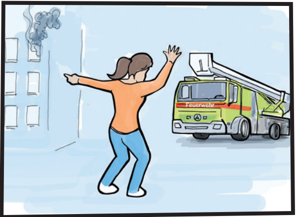
ነቶም መጥፋት ሐዋ ሓብሮም