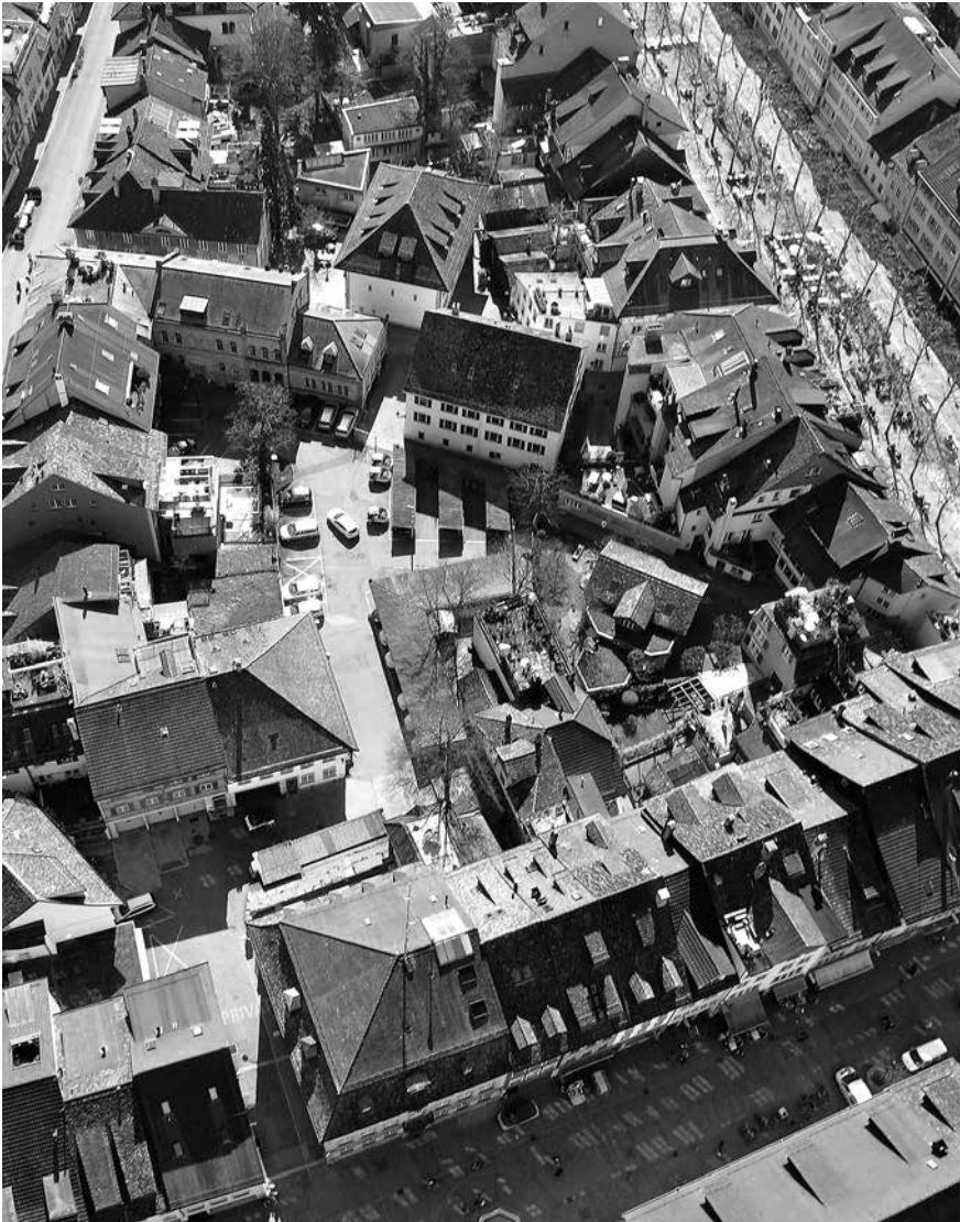
Luftaufnahme an der heutigen Lage am Obertor.

sind, beeinträchtigen die Wohnqualität der anwohnenden Quartierbevölkerung erheblich. Insgesamt vermögen die örtlichen Gegebenheiten und die vorhandene Infrastruktur am Obertor die Anforderungen an eine zeitgemässe Stadtpolizei schon lange nicht mehr zu erfüllen.