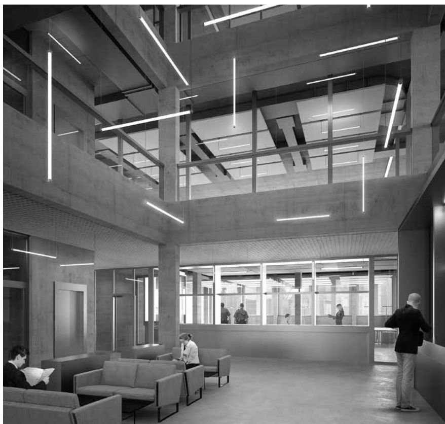
Eine helle dreigeschossige Eingangshalle empfängt die Besuchenden. (Visualisierung)