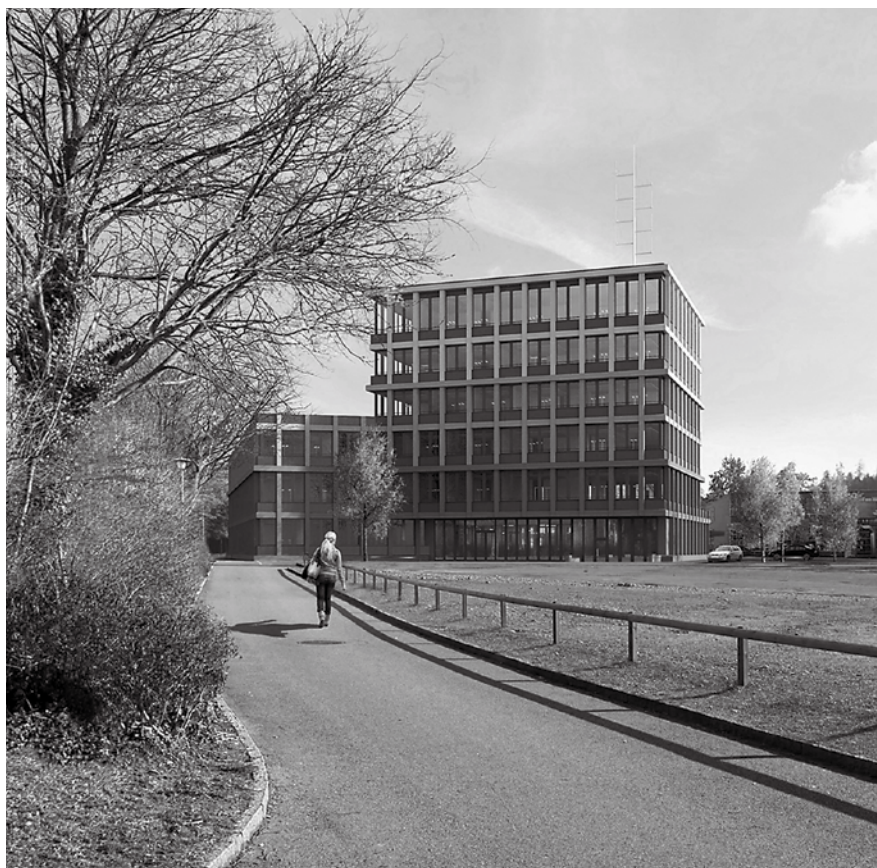
Das neue Polizeigebäude soll an der Obermühlestrasse erstellt werden. (Visualisierung)

auch technisch veraltet. Die Arbeitsplätze für die rund 250 Mitarbeitenden sind teilweise nicht mehr zumutbar und entsprechen auch nicht mehr den arbeitsrechtlichen Vorschriften. Die Lärmemissionen, die mit dem Polizeibetrieb rund um die Uhr zwangsläufig verbunden